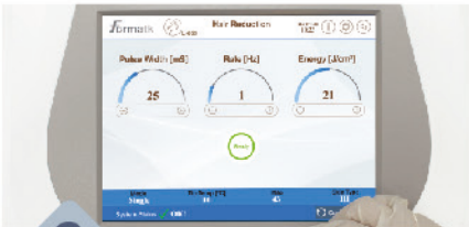
2 Geben Sie das Messergebnis in das Gerät einlegen