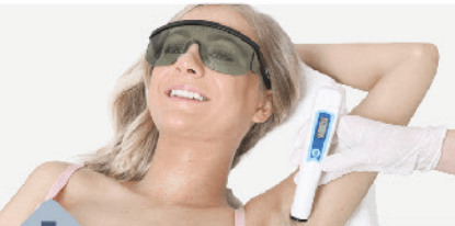
1 Milo auf die Haut auflegen