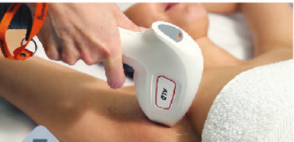
3 Durchführung der Behandlung